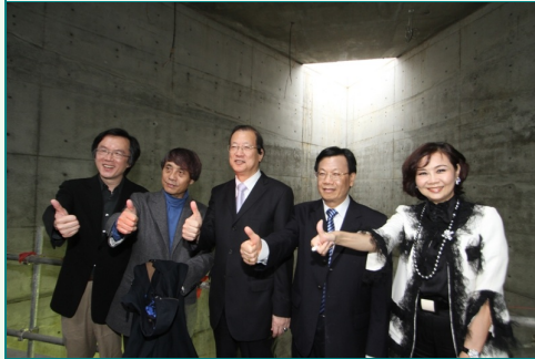
圖說：國際建築大師安藤忠雄(左二)、亞洲大學蔡長海創辦人(中)、校長蔡進發(右二)、副校長劉育東(左一)、林嘉琪董事在安藤忠雄藝術館內一起比「讚」。