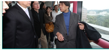
圖說：安藤大師建築大師(右)在亞洲大學藝術館內巡視一、二、三樓。

板模、攪拌混凝土、灌漿到拆模，都是純手工打造，還得在慢工出細活、分毫不差、保持濕度等要求下完成，稱上是國際級完美建築物。