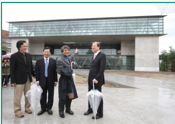
圖說：亞洲大學安藤忠雄藝術館主體完工，國際建築大師安藤忠雄(右二)、亞洲大學蔡長海創辦人(右)、校長蔡進發(左二)、副校長劉育東一起前往視察。

「我與亞大師生都很期待這棟建築誕生！」安藤忠雄說，由於這棟藝術館包含許多意義，所以一定要蓋成世界一流的建築物，儘管踏出第一步是最難的，但台灣人用熱情、力量來面對，把三角建築蓋出來，這是台灣人的元氣，連日本人都應該學習，把困難的事情做好，才是最好；希望亞洲大學的學生抱持著這樣的想法，從這裡三角型藝術館出發，走向國際。