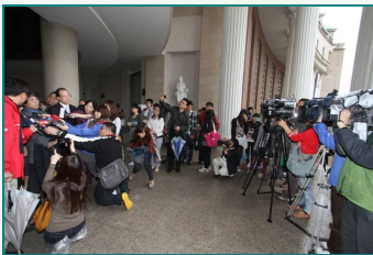
圖說：亞洲大學安藤忠雄藝術館主體完工，安藤忠雄大師親自視察，眾多媒體蒞校採訪。

亞洲大學安藤忠雄藝術館主體完工，安藤忠雄大師今天視察，滿意工程品質，稱讚絕對不輸給全世界任何一棟藝術館。